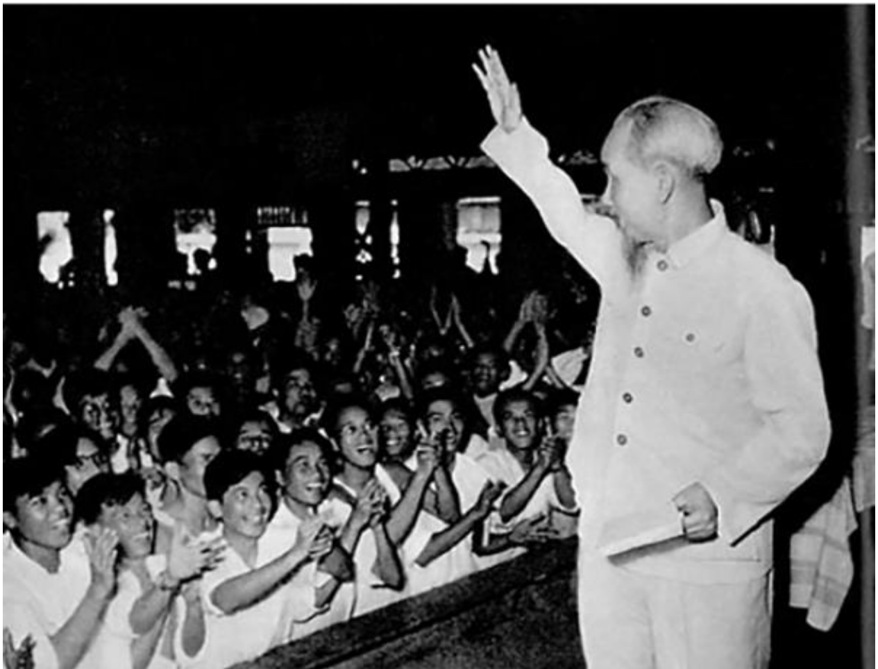
Bác Hồ thăm đại biểu giáo viên toàn miền Bắc năm 1958.

(HCM.VN) - Sự nghiệp trồng người - giáo dục đào tạo được xác định rõ là sự nghiệp chung của Đảng, Nhà nước và toàn xã hội, nhưng người trực tiếp thực hiện nhiệm vụ là nhà giáo. Theo Chủ tịch Hồ Chí Minh, vấn đề then chốt quyết định chất lượng giáo dục đào tạo chính là đội ngũ những người thầy giáo và cán bộ quản lý giáo dục.